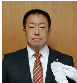
三期目の議員バッジ(令和5年5月8日)

今期は「民生環境水道常任委員」、「広報広聴常任委員会副委員長」、「議会運営委員」、「議会改革推進協議会副会長」、「DX推進委員会委員長」、「スポーツ推進審議会委員」等を拝命いたしました。広報広聴と議会改革という、