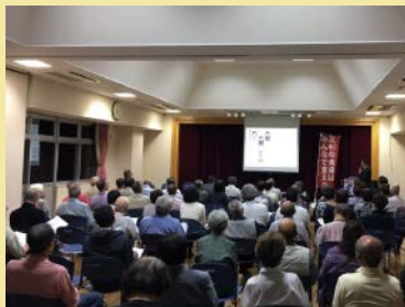
▲第3回市政報告会(梁田公民館H29年5月12日)